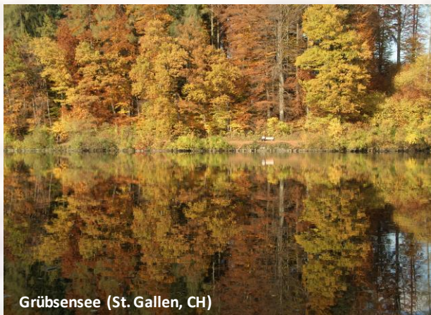
Grübsensee (St. Gallen, CH)