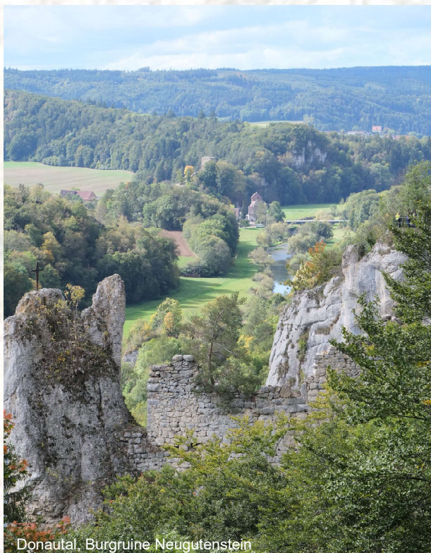
Donautal, Burg Ruine Neugutenstein